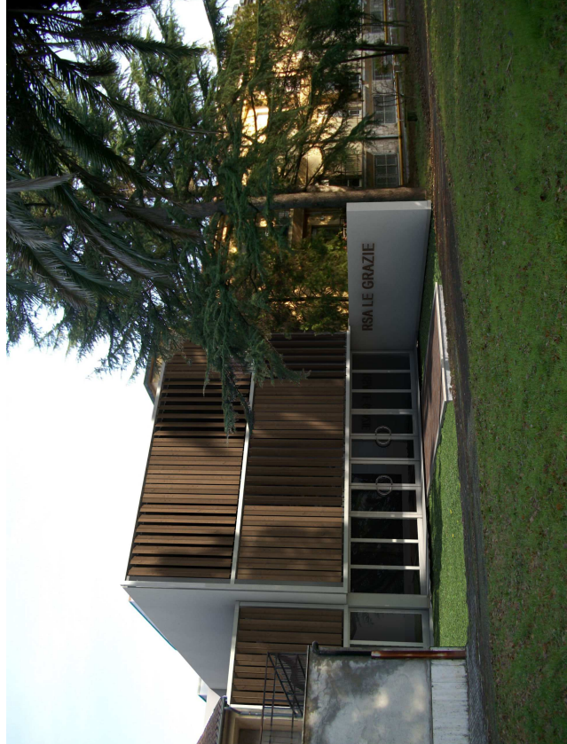
TITOLO: PROGETTO ESECUTIVO

Lavori di adeguamento alle norme antincendio del centro di assistenza geriatrica residenziale "Le Grazie"