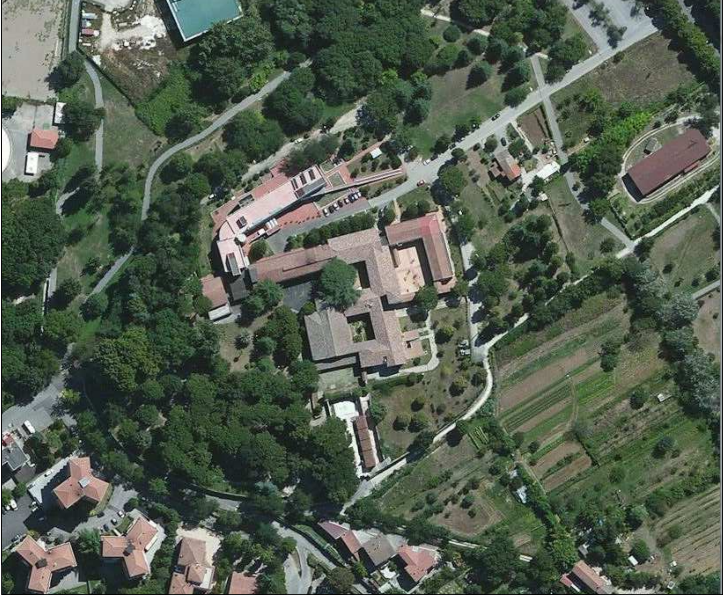
VISTA AREA ZENITALE