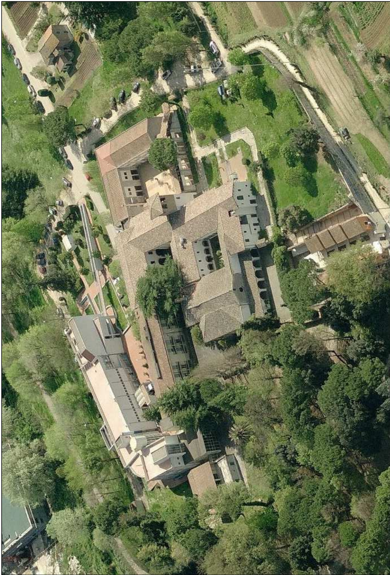
VISTA AREA DA OVEST