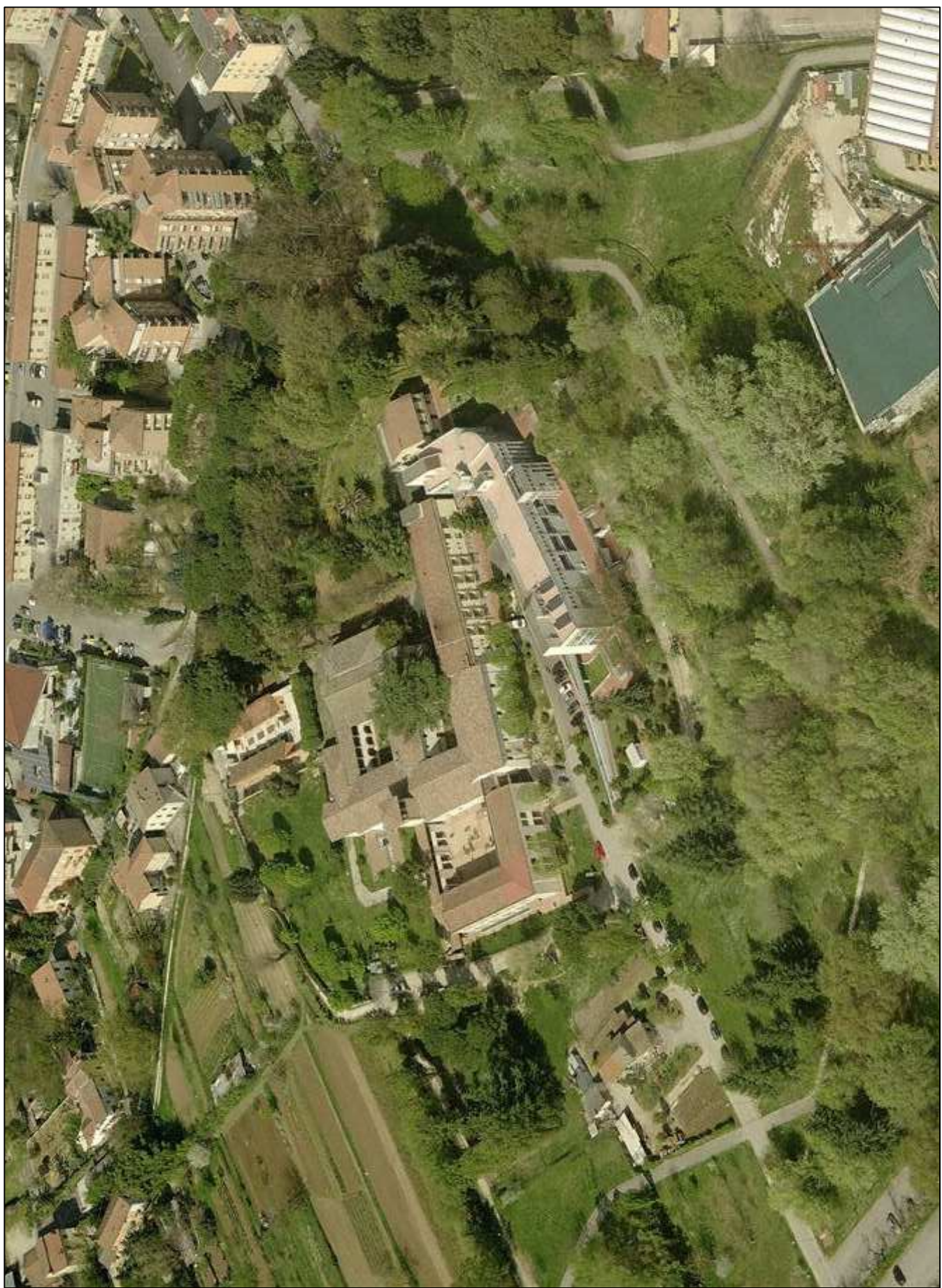
VISTA AREA DA OVEST